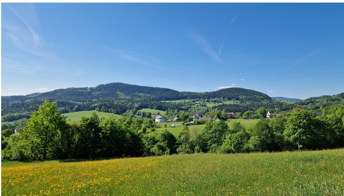
5. Widok na przetęcz z PK14

Potruchaliśmy dalej niebieskim szlakiem. Za Pasierbiecką Górą zesliśmy ze szlaku kierując się na zachód i zbiegliśmy do łąki. Odbiliśmy w las i schodząc na przetaj większą grupą dotarliśmy do potoku. Prześliśmy go i doszliśmy do asfaltowej drogi. Było wcześniej rano, ale czuć było, że słońce już grzeje. Poszliśmy kawałek na północ, odbiliśmy znowu na zachód i idąc przez piękne łąki odbiliśmy się na PK13 na północ od Jaszczurówki. Zbiegliśmy do Nowego Rybia i równoległą do głównej drogą poleciliśmy na południe. Ominęliśmy sklep i błędnie odbiliśmy na wschód. Po krótkiej chwili zawróciliśmy i zobaczyliśmy świeżo wydeptaną przez poprzedników ścieżkę. Dalej cały czas asfaltem, kierując się na południowy zachód dotarliśmy do zielonego szlaku niedaleko Kostrzy. Przed nami ukazała się przetęcz między szczytami Stronia i Żezów. Było to ostatnie podejście, i jak to lubią robić organizatorzy, wyjątkowo strome na sam koniec. O godz. 9:32 i 87 km zameldowaliśmy się na PK14 .