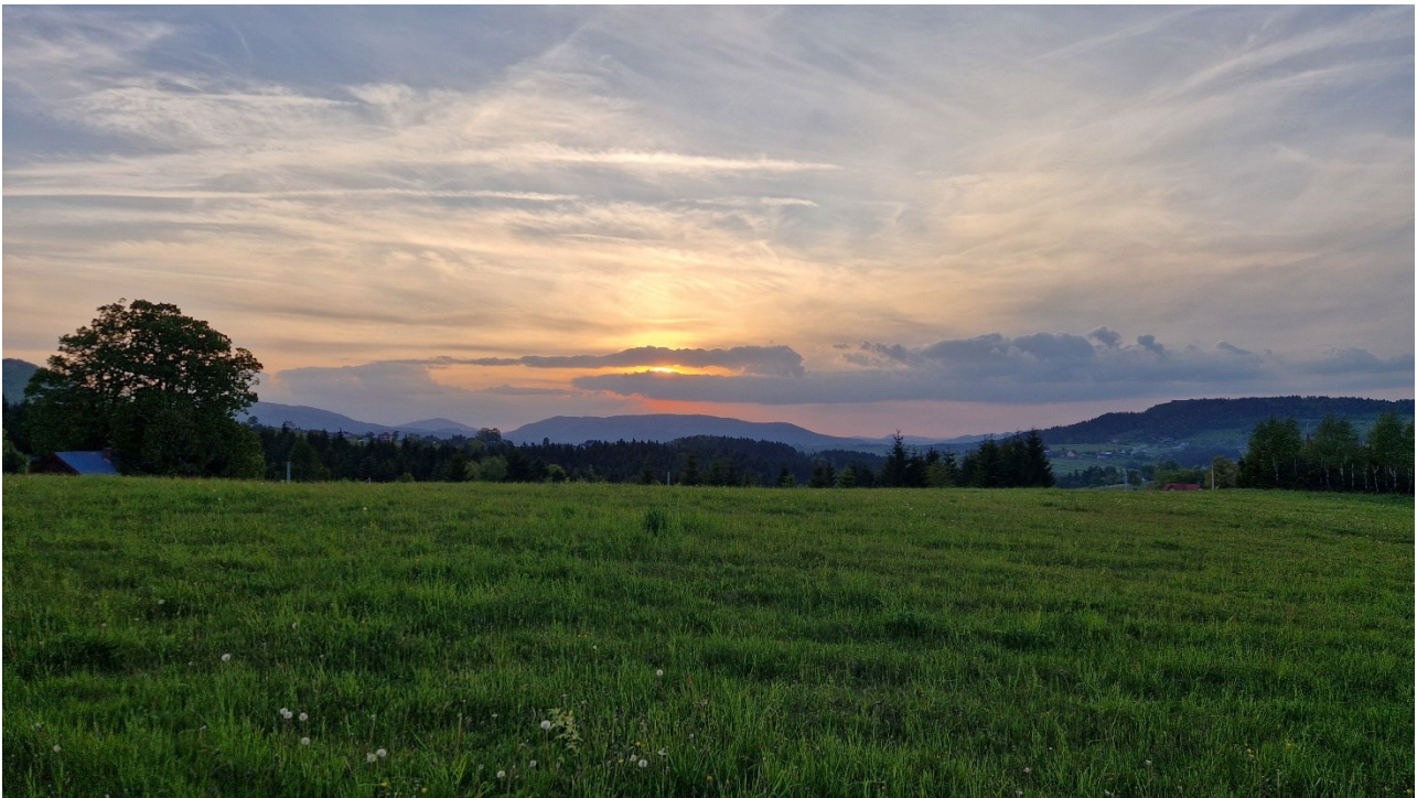
2. Przed zachodem słońca

Inaczej niż trasa wzorcowa, dalej skierowałem się na północny wschód najpierw ścieżką przez las, potem asfaltem w dół do głównej drogi. Później na wschód ścinając przez łąki, w kierunku szczytu Łyżka, który małą grupą obiegliśmy z północnej strony i niewiele później odbiliśmy się na PK3 . Wybierając ten wariant skróciliśmy trasę o 2 km w stosunku do dystansu z mapy. Dalej droga prowadziła cały czas asfaltem. Zbiegliśmy do Przyszowej i podeszliśmy do miejscowości Wysokie. Zapadł zmrok więc zapaliliśmy czołówki. Na tym odcinku poznałem Zbyszka, kieratowego wyjadacza, który trzymał podobne tempo, i z którym do końca trzymaliśmy się razem. Przeszliśmy przez drogę krajową i od zaplecza odbiliśmy się na PK4 o godz. 21:23 i 23,5 km. Uzupelniliśmy wodę.