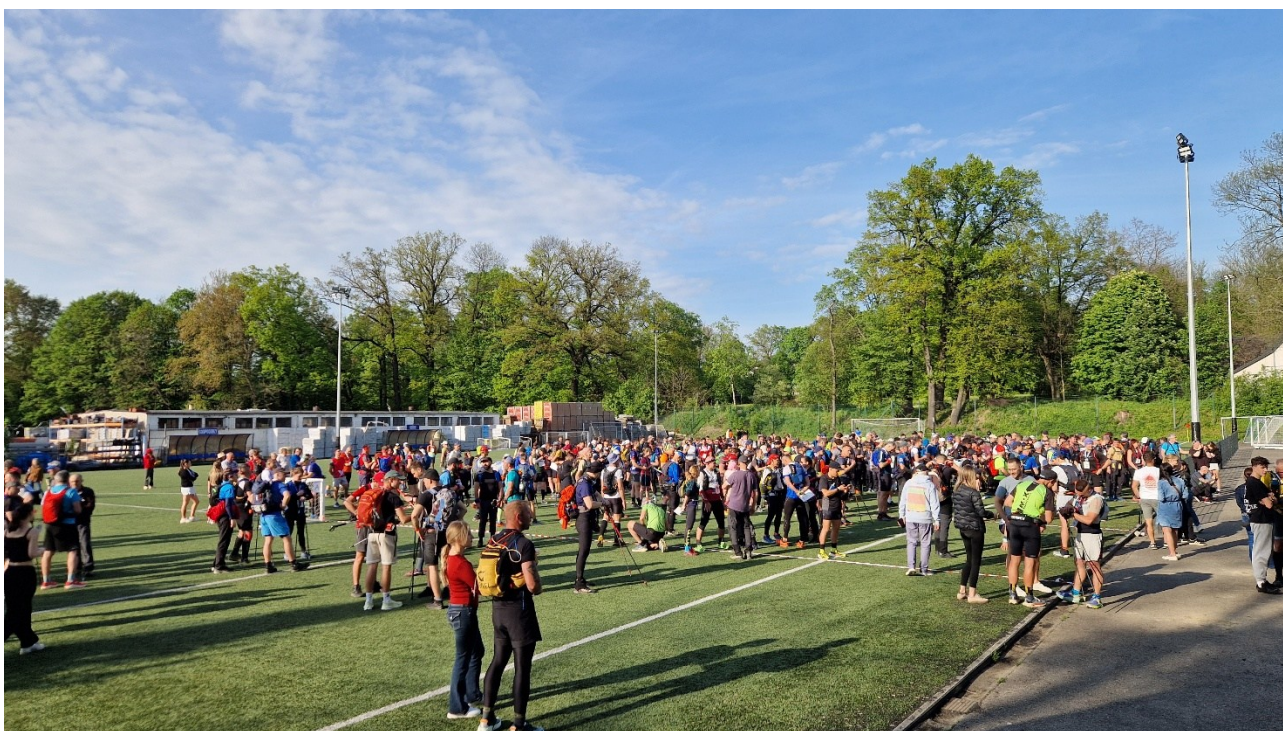
1. Przed startem